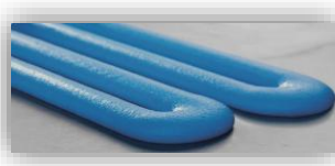
放熱ギャップフィラー