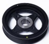
ダンパープーリー

現在、当社グループは、米国においてFukoku America Inc.（米国サウスカロライナ州）により、樹脂ブーツの製造・販売、ならびにブレーキシール、防振ゴム、ワイパーブレードなどの販売を行っております。今回の新法人設立により製品ラインナップを拡充し、米国市場における拡販と当社グループのグローバル事業の基盤強化を図ってまいります。